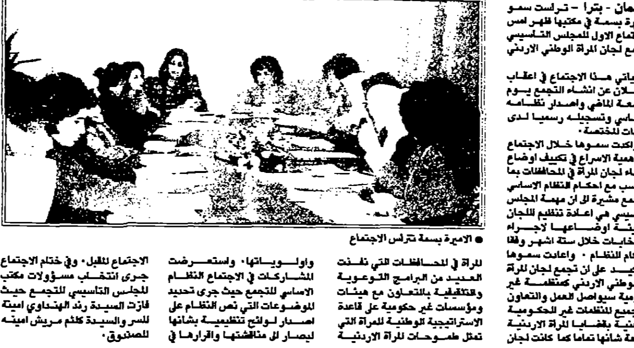
الاميرة بسمة تترأس الاجتماع

عمان - بترا - تراس سمو الاميرة بسمة في مكتبها ظهر امس الاجتماع الاول للمجلس التأسيسي لتجمع لجان المرأة الوطني الاردني. وياتي هذا الاجتماع في اعقاب الاعلان عن انشاء المجلس التأسيسي للجمعية للاضي واصدار نظامه الاساسي وتسجيله رسميا لدى الجهات المختصة. ولكت سموها خلال الاجتماع على اهمية الاسراع في تعييف الاجتماع اعضاء لجان المرأة في المحافظات بما يتناسب مع احكام نظام الاساسي للتجمع مشيرة الى ان مهمة المجلس التأسيسي هي اعادة تنظيم اللجان وتعيين اوقاسها لاجراء الاختيارات خلال ستة اشهر وفقا لاحكام النظام. واعادت سموها التأكيد على ان تجمع لجان المرأة الوطني الاردني كمنظمة غير حكومية سيواصل العمل بالتعاون مع جميع المنظمات غير الحكومية وللحشد بقضايا المرأة الاردنية ورغبة شائنا تماما كما كتلت لجان